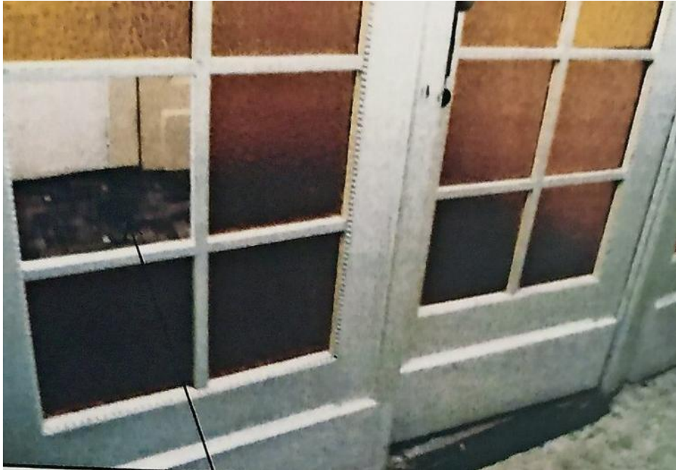
Die Scheibe links sei beschädigt worden, lautete am Ende der Tatvorwurf.

Im Dezember 2018 fassten sich die beiden Geschwister ein Herz. Sie suchten das Mehrfamilienhaus in der Neustadt auf und hörten schon unten im Hausflur ein klagendes Miauen aus dem dritten Stockwerk.